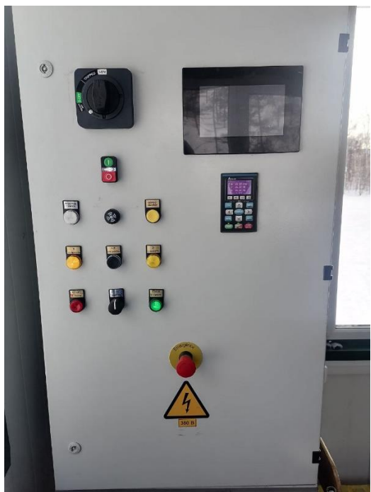
ОБЩИЙ ВИД ШУ